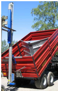
V-mallinen takalaita (C-paketti)

Kuljettimien siirtely trukilla tai nostokoukulla on helppoa.