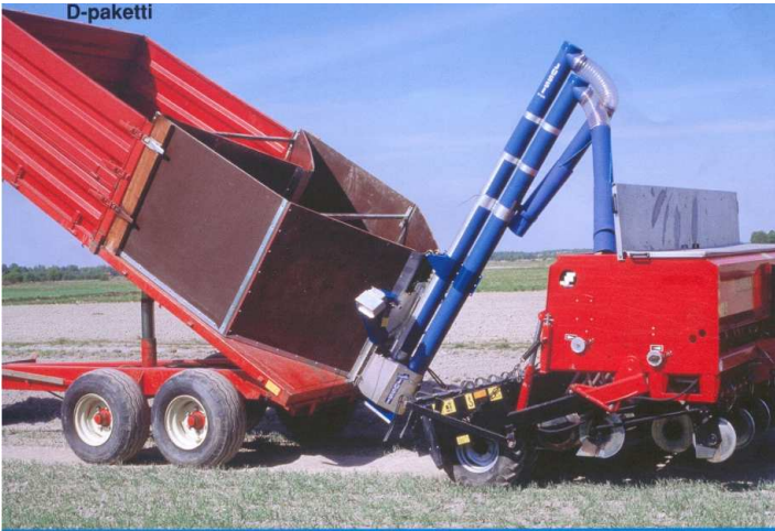
Pohjallinen siemenkasetti (D-paketti)

Helppokäyttöinen - kylvökoneen tai peräkärryn laitaan asennettavan käyttöventtiilin vivulla valitaan kumpi ruuveista pyörii (Pat.no 81766).