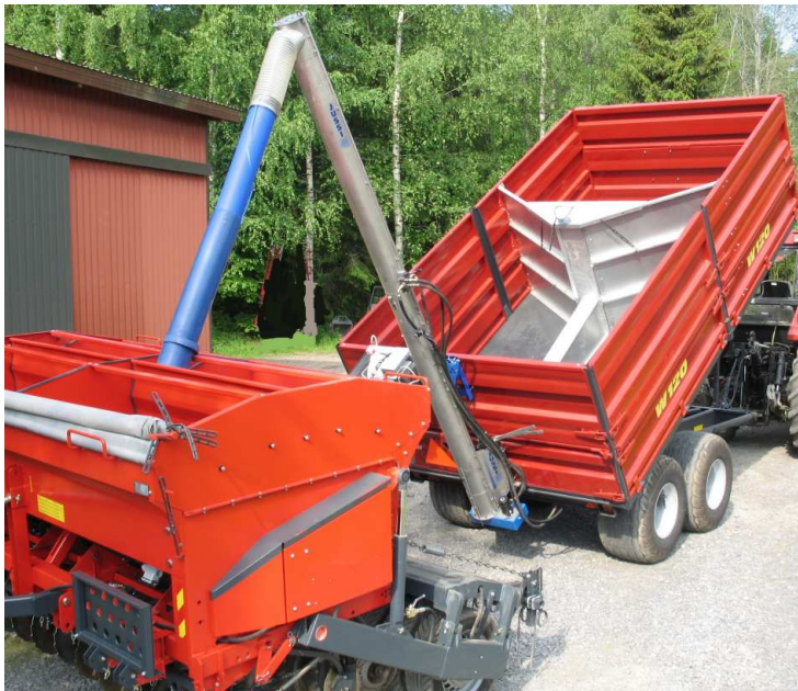
B-paketti välilaitaelementein (M200)

Ruuvien käyttö on helppoa kylvölannoitintraktorillakin, koska ruuveihin on saatavana lisävarusteena pikakiinnitteisen moottorin alakiinnityssarja. (hydraulimoottori kulkee kylvettäessä kylvökoneen mukana ja öljyisiä pikaliittimiä ei tarvitse avalla).